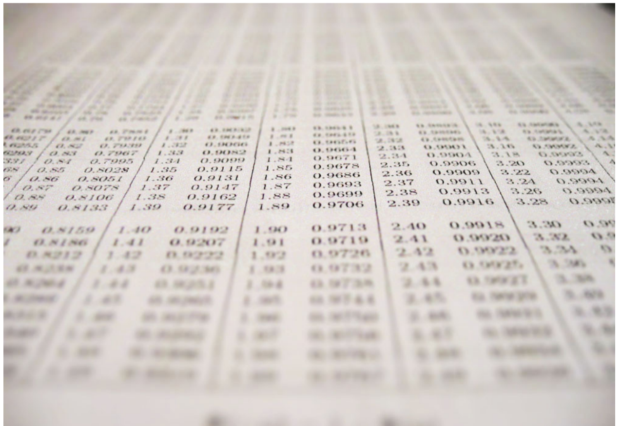
Statistiken talar sitt tydliga språk. Klimatförändringarna märks redan i dag och det får återverkningar på hur man ska bygga.

Tidigare var det praxis att använda klimatfiler som speglar perioden 1965–1984 och togs fram av SMHI på 1980-talet. Men de senaste åren har allt fler valt att ta fram egna väderfiler, till exempel